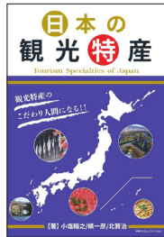
書籍「日本の観光特産」