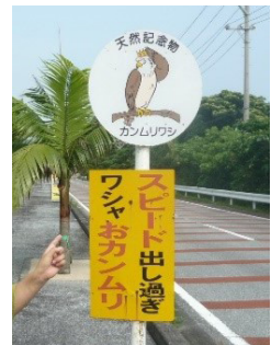
西表島にて。ロード・キルトオーバー・ツーリズムの深刻さに心が痛みます

また、観光業に携わる方々に向けて、「観光プランナー」や「観光コーディネーター」資格の研修講義も行っています。日本各地には地域特有の産物や産品があります。これらを観光需要者に対して、どのように認知度を上げ、購買量の増加へと繋いでいくか、また、生産地への来訪に繋げられるか。観光プランナーは、話題作りからプランニングまで携わります。そして、その後に伴う、地域の産物・産品として創り上げた、モノやコトの需要と供給を継続的に循環させる仕組みや、地域経済・地域産業の造成と活性化へと導いていくのが、観光コーディネーターです。類似するものも多い現世では一過性、一度きりの体験で終わってしまいます。今ある顧客ニーズだけでなく、新たなニーズを創造し注目させる。観光産業を率先し従事していくリーダーを育てていければと願っています。