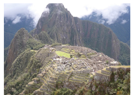
谷底から吹き上げる風が瞬時に雲を消す 天都市「マチュ・ピチュ」は、まさにドラマチック

世界遺産を学んだ者として、個々の遺産の素晴らしさを語るとともに、遠くの世界のコトではなく、自分の世界での関わりとして、ユネスコ憲章前文の「平和のとりで」や世界遺産条約の理念をしっかりとお伝えしていきたいです。自己見解を発する前に、まずは「とりで」の中に仕舞って、多角的・俯瞰的に見直す。世界遺産とその周辺地域は、先代の時から伝承されてきたあらゆる営みが、今を生きる我々にコミュニケートしています。変化し続ける社会・文化、自然環境の中で、平和な今日を築いていくモノやコトを未来へと繋げていきたい、と考えています。