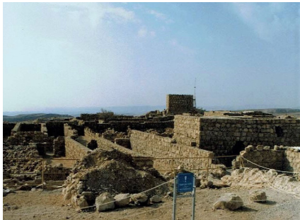
マサダ山の風景。この下に塩湖・死海が広がる

現在は独立起業していますが、かつては、とある中堅旅行会社に身を置いていました。パリの街並みやノートルダム大聖堂、ヴァチカン市国やローマも、仕事上の観光スポットとしての認識が強かったのですが、同業者でもある私のパートナーが世界遺産検定を勉強し始めたのをきっかけとして、私自身も世界遺産に興味を持ち、いつの頃からか、各国の観光地を違った角度から意識し始めるようになりました。何事も知識が強みとなることが、往々にしてあります。世界遺産という言葉を知り修学することで、目前の観光スポットを「これが世界遺産です」と真実味をもって力強く語ることができ、お客様の興味を引き出し、より深い旅行体験へと導くことができます。顧客の獲得や困り